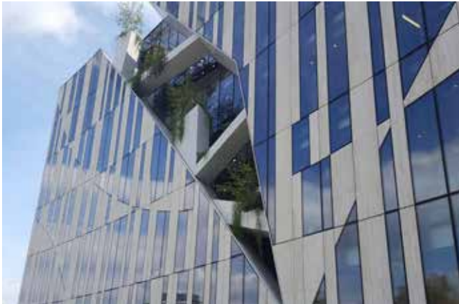
Firmensitz der Unicorn Real Estate, Düsseldorf Königsallee 2B

Unicorn Real Estate GmbH ist ein junges und innovatives Unternehmen mit mehr als 20 Jahren Erfahrung mit Netzwerkpartnern in der Immobilienbranche sowie im Bereich der Finanzdienstleistungen.